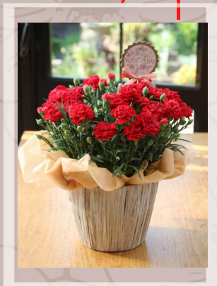
01 赤カーネーション ¥2750(税込) 高さ30cm×横25cm