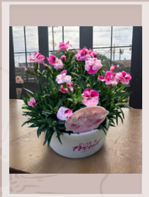
オリジナル鉢 02 バイカラーカーネーション 'ピンク&プラウド' ¥2750(税込) 高さ30cm×横25cm