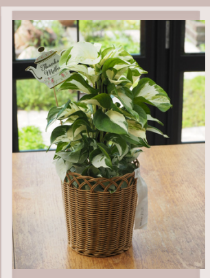
10 UTILEバスケット ポトス'ステータス' ¥3850(税込) 高さ45cm×横25cm