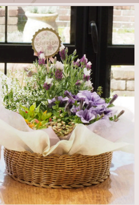
06 UTILEバスケット 寄せ植えセット(L) ¥4400(税込) 高さ35cm×横35cm