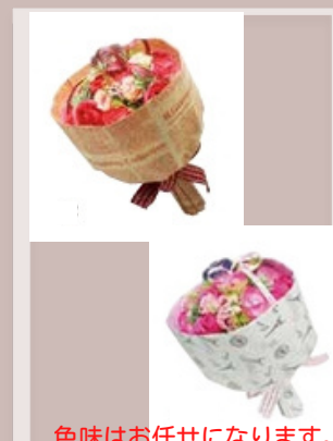
11 ソープフラワーブーケ ¥4400(税込) 高さ30cm×横20cm