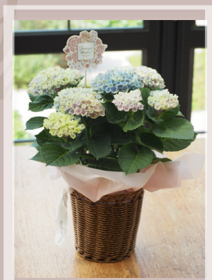
09 UTILEバスケット アジサイ 'マジカル レボリューション' ¥3850(税込) 高さ35cm×横30cm