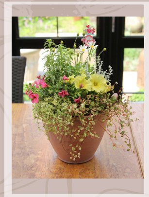
04 '季節の寄せ植え' ¥4950(税込) 高さ45cm×横25cm