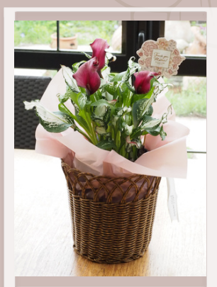
斑入り葉! 07 UTILEバスケット カラー'フローズンクイーン' ¥4400(税込) 高さ30cm×横25cm