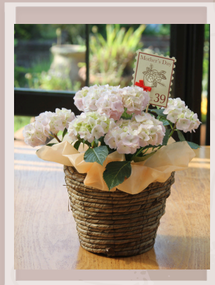
03 ヤマアジサイ '伊予獅子てまり' ¥3850(税込) 高さ35cm×30cm