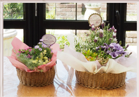
05 UTILEバスケット 寄せ植えセット(S) ¥3300(税込) 高さ25cm×横25cm